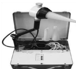
Р и с. 2 3 . О б л у ч а т е л ь у л ь т р а ф и о л е т о в ы й р т у т н о - к в а р ц е в ы й Б О П - 0 1 / 2 7

Портативная ртутно-кварцевая лампа (ПРК-4) . Вмонтирована в чемодан. Работает от сети 127 и 220 В. Отражатель маленький, прямоугольный, как у ПРК-2, но меньший наполовину. Источник света – горелка ПРК-4 плавящего кварца, который легко пропускает ультрафиолетовые лучи. Аналогом является ртутно-кварцевая лампа БОП-01/27 (рис. 23).