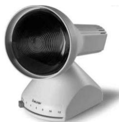
Р и с. 1 7 . Н а с т о л ь н а я л а м п а - с о л л ю к с ф и р м ы В е и г е r Лампа Минина

Если в течение 0,5–1 минуты тыльная сторона кисти руки ощущает значительное тепловое действие, не вызывая боли, то можно считать, что расстояние или степень накала спирали достаточные. Если же ощущается слабое тепло, следует увеличить накал спирали лампы или время облучения от 10 до 20 минут. Процедуры ежедневные. Количество процедур зависит от вида заболеваний и соответствующего эффекта лечебных процедур.