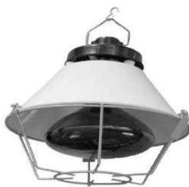
Р и с. 2 1 . О б л у ч а т е л ь п о д в е с н о й С С П – 0 9 - 2 5 0 - 0 0 1

(сбивание поросят под облучатель), время облучения – круглосуточно, до отъема.