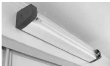
Р и с. 2 4 . И с п о л ь з о в а н и е б а к т е р и ц и д н ы х л а м п д л я с а н а ц и и п о м е щ е н и я

Электрический разряд в смеси паров ртути с аргоном служит источником излучения, большая часть которого приходится на линию с длиной волны 254 нм, соответствующей области наибольшего бактерицидного действия. Для санации помещений в присутствии животных используются бактерицидные лампы, смонтированные в установку ДЕЗАР (рис. 25).