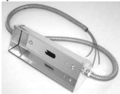
Р и с. 1 9 . Л а м п а д л я И К- и з л у ч е н и я

Лампа КИ 220-1000 представляет собой цилиндрическую колбу диаметром 10 мм, изготовленную из кварцевого стекла, хорошо пропускающего ИК-излучение.