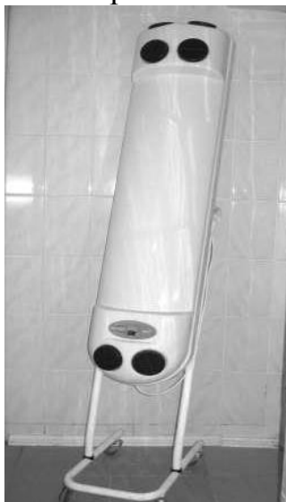
Р и с. 2 5 . У с т а н о в к а Д Е З А Р д л я с а н а ц и и и а э р а ц и и п о м е щ е н и я

Расчет параметров ультрафиолетовых облучательных установок – одна из ответственных трудоемких задач. Основными параметрами ультрафиолетовых облучательных установок являются нормированное значение облученности, система облучения, тип облучателей, размещение облучателей и продолжительность работы.