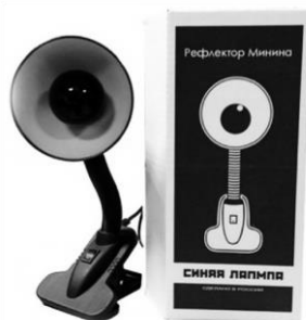
Р и с. 1 8 . Л а м п а М и н и н а

Эффект действия зависит от инфракрасных или синих лучей. Расстояние от лампы – 15–20 см, однако при этом следует учитывать реакцию больного животного. Для прогревания небольших участков тела лампу устанавливают контактно или на расстоянии 5–7 см от пациента. Время облучения 15–20 минут. Процедуры ежедневные или 2 раза в день.