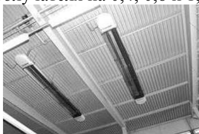
Р и с. 2 0 . И с п о л ь з о в а н и е « т е м н о г о » И К- и з л у ч а т е л я н а с в и н о ф е р м е

«Темный» ИК-излучатель представляет собой металлическую трубку, внутри которой расположена нихромовая спираль, служащая нагревателем и уложенная в огнестойкую изоляционную массу (рис. 19). Отсутствие контакта спирали с воздухом обеспечивает срок службы темных излучателей до 10 тыс. ч. Они генерируют ИК-лучи с максимумом около 1000 нм, выпускают их в комплексе с арматурой. С этой целью используется облучатель ОКБ-1376А, представляющий собой стальной кожух с закрепленными в верхней части тремя ТЭНами. Стенки кожуха двойные, пространство между ними заполнено теплоизоляционными массами. Снизу на облучателе предусмотрена защитная сетка. Каждый ТЭН мощностью 0,4 кВт имеет выключатель, что делает возможным 3-ступенчатое включение облучателя на 0,4; 0,8 и 1,2 кВт.