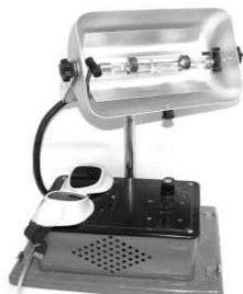
Р и с. 2 2 . Л а м п а д л я У Ф - т е р а п и и П Р К - 2

горелок не в спектральном составе излучения, а в количестве лучей. Наименьшее количество лучей дает горелка ПРК-4. Излучение во всех этих горелках образуется за счет паров ртути, которые при прохождении через них электрического тока раскаливаются.